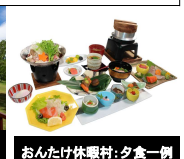
おんたけ休暇村: 夕食一例