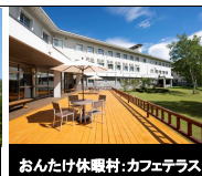
おんたけ休暇村: カフェテラス