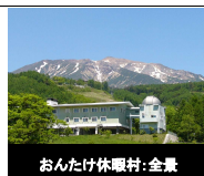
おんたけ休暇村: 全景