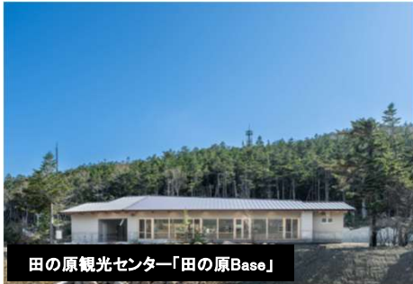
田の原観光センター「田の原Base」